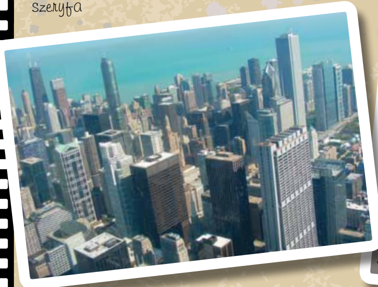
Widok z Willis Tower w Chicago - 443 m