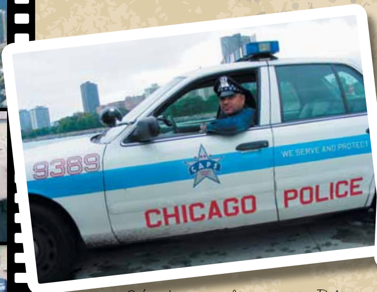
W radiowozie chicagowskiej Policji