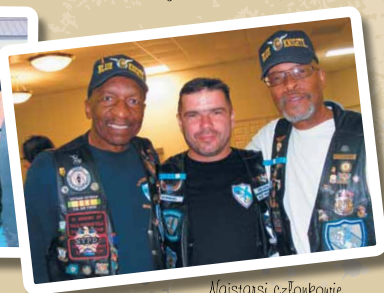
Najstarsi członkowie Blue Knights na zlocie