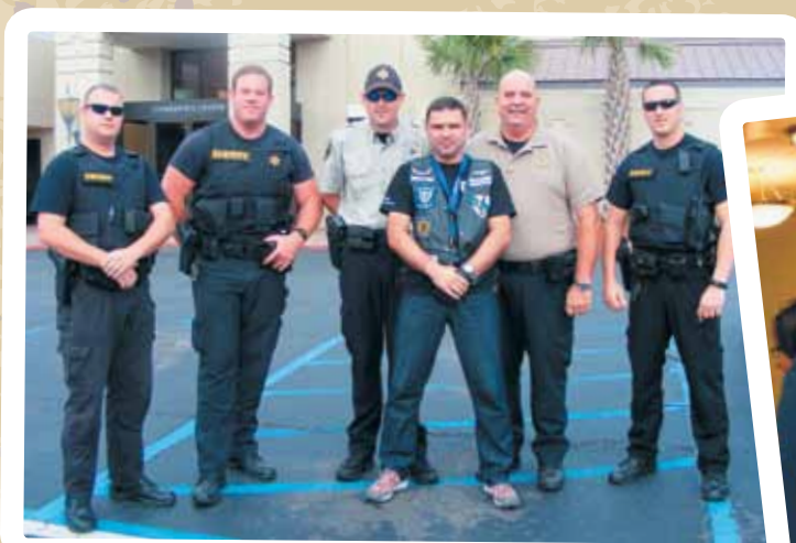
Mobile w Alabamie - ludzie szeryfa