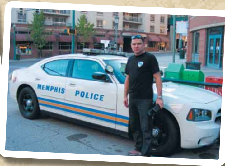
Beal Street w Memphis na wieczór zamykane przez Policję